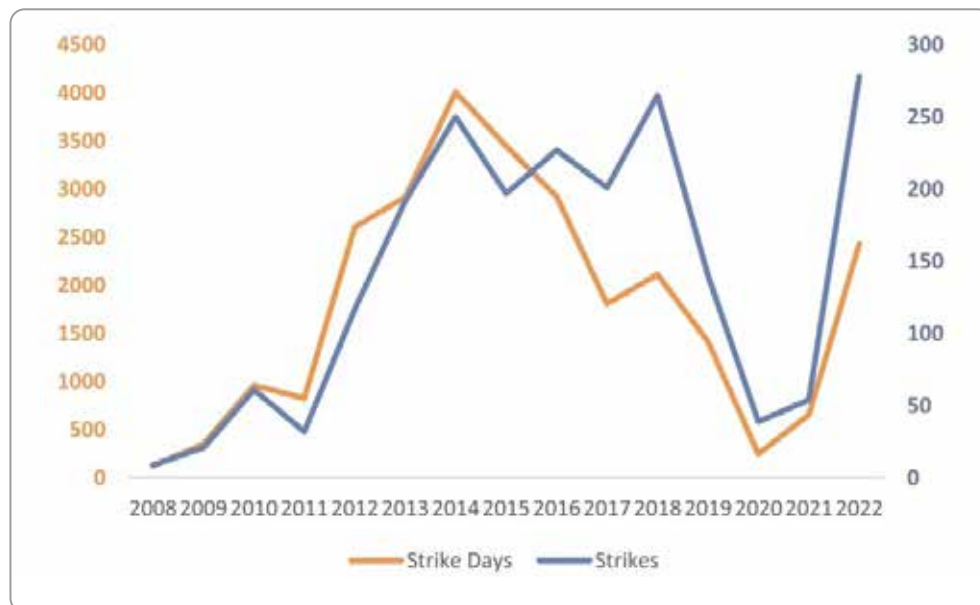
Gráfico 2: Greves e dias de greve de professores/as municipais (Brasil, 2008-2022)