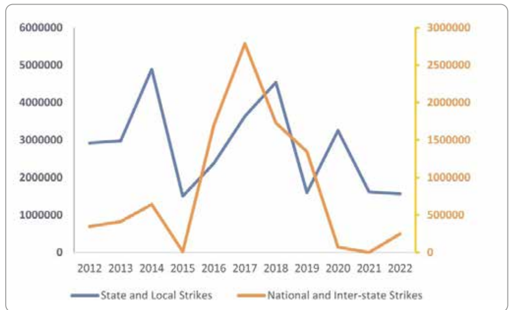
Gráfico 1: Dias individuais de greve – DIGs por greves nacionais e estaduais/locais (Argentina, 2012-2022)

foram definidos por lei em 2008. Considerar os sindicatos como agentes da estruturação do RTD também é fundamental, porque na verdade eles têm influência na divisão do trabalho dentro do aparato estatal no que diz respeito ao emprego dos/das professores/as. Isso fica claramente ilustrado pelos seguintes exemplos nos três países estudados: na década de 1990, o sindicato mexicano impediu um processo de descentralização mais radicalizado e, na década seguinte, as federações argentina e brasileira conseguiram fazer com que os governos federais fixassem um salário mínimo nacional para professores/as. Portanto, não apenas os governos, mas também os sindicatos desempenham papéis estruturantes na realidade multiescalar do RTD.